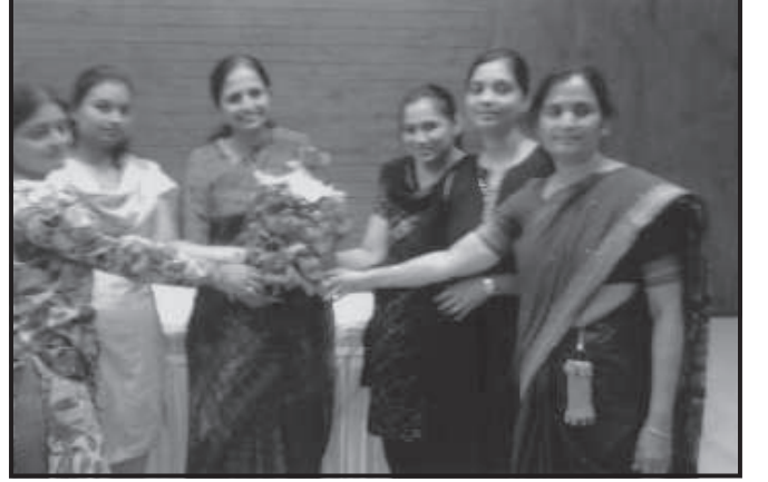
કુર્કિંગ નિષ્ણાતનું બહુમાન કરતા સમિતિના સભ્યો