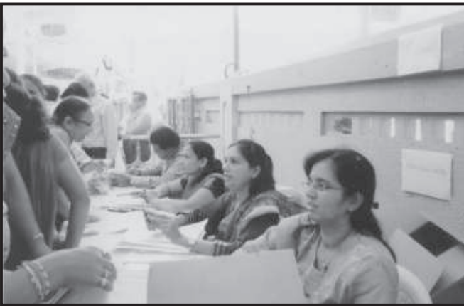
સ્વામિવાત્સલ્યના દિવસે સંપૂર્ણ બોડી ચેક-અપ નોંધણી કાર્યક્રમમાં કાર્યરત સમિતિના સભ્યો