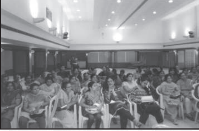
કુર્કિંગ ડેમોન્સ્ટ્રેશનના કાર્યક્રમ દરમ્યાન હાજર રહેલ બહેનો.