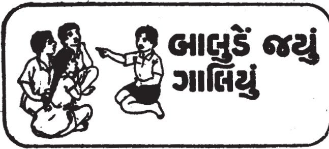
સંકલન : ગુલાબચંદ ધારશી રાંભિયા

ટીના : આ બંને જણા મારું નામ ડાર્લિંગ સમજી બેઠા છે. આજે સવારે જ મને રસોઈયો પૂછતો હતો કે બપોરના