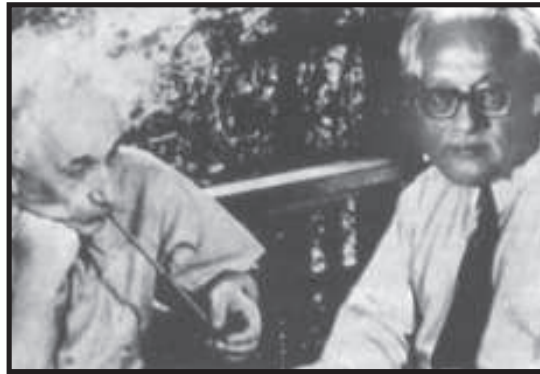
આલ્બર્ટ આઈન્સ્ટાઈન અને સત્યેન્દ્રનાથ બોઝ

આધુનિક વૈજ્ઞાનિકોના મત પ્રમાણે બ્રહ્માંડની રચના માટે ૧૨ સૂક્ષ્મ કણો જવાબદાર ગણવામાં આવે છે. ઉપરોક્ત પ્રયોગથી ૧૧ કણોને તો શોધી શકાયા કે જે વજનમાં હલકા હતા અથવા તો તેઓમાં દ્રવ્ય ન હતું. બારમા કણો શોધવાનું બાકી હતું. માન્યતા પ્રમાણે તે વજનમાં થોડું ભારે એટલે કે દ્રવ્ય વાળું હતું. તેને “હિગ્ગ્સ બોઝોન” કણ નામ આપવામાં આવ્યું. તેને શોધવા માટે ખૂબજ ઊર્જાથી પ્રોટોનને વિરુદ્ધ દિશાએથી ટકરાવવા પડે અને તોજ તેના દર્શન થઈ શકે તેવી વૈજ્ઞાનિકોની માન્યતા હતી. હિગ્ગ્સ બોઝોન પાર્ટીકલ બ્રહ્માંડ જન્મ્યું ત્યારે ઉત્પન્ન થયા હતા. માટે તેના દર્શન કરવા હોય તો બ્રહ્માંડ જન્મ્યું ત્યારે જે બિગ બેંગની પરિસ્થિતિ હતી તેવી પરિસ્થિતિનું નિર્માણ કરવું પડે.